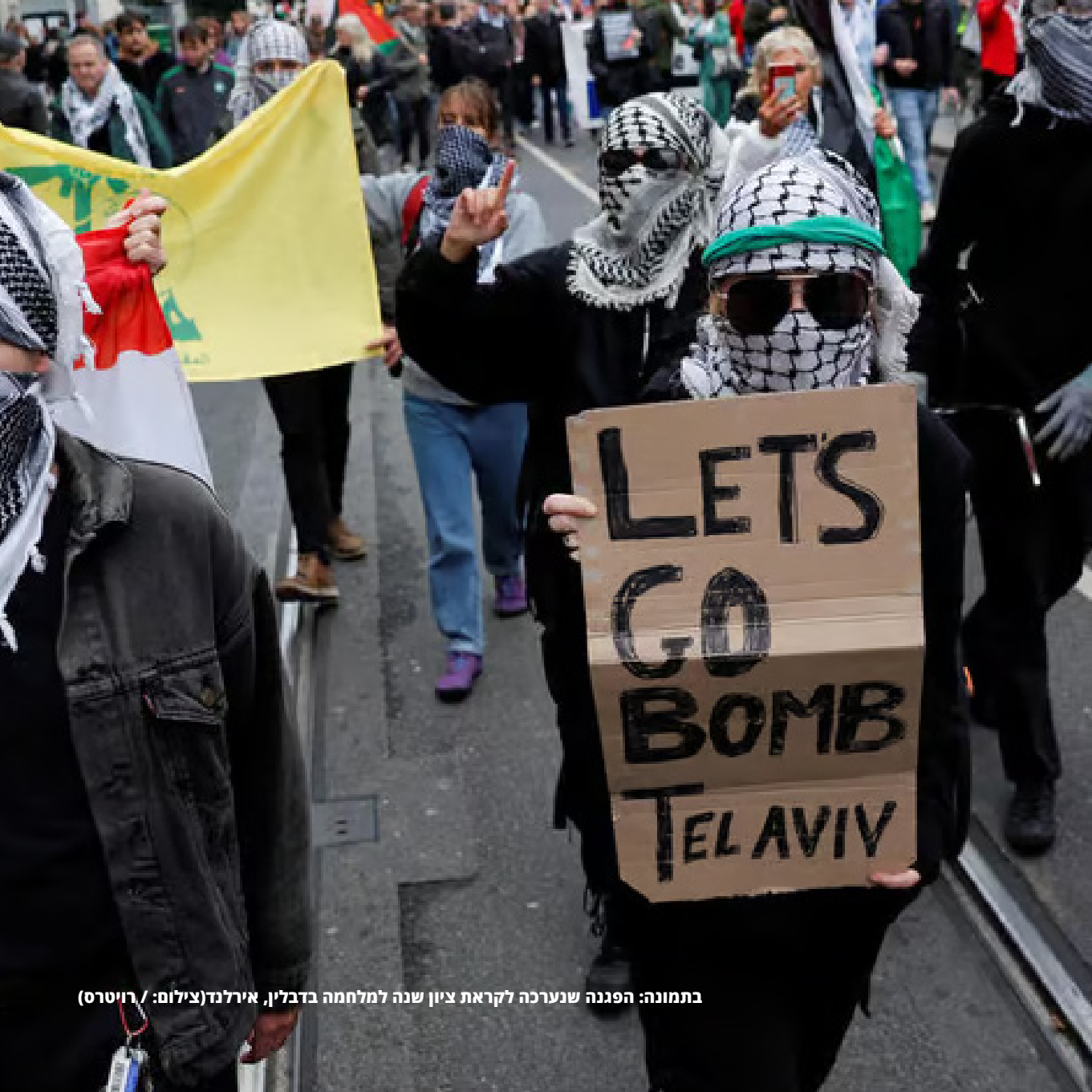
בתמונה: הפגנה שנערכה לקראת ציון שנה למלחמה בדבלין, אירלנד